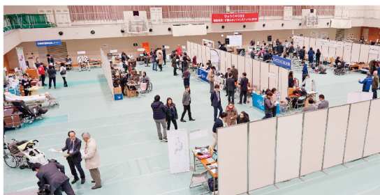
※令和元年度のフェスティバルの様子