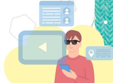
スマートサングラス